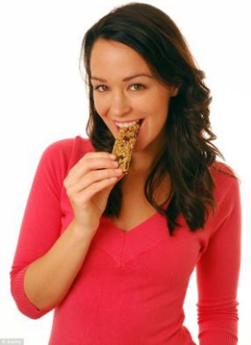
Les collations en barre sont plus populaires chez les femmes que chez les hommes