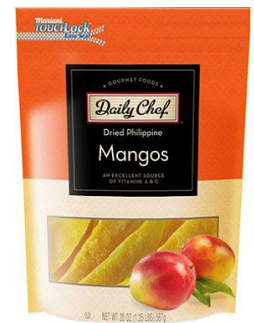
Mangues séchées comme en-cas santé chaque jour

Plus de disponibilité. Les mangues sont devenues à la fois plus populaires et plus disponibles dans le monde. Les mangues fraîches trop mures ou déclassées des marchés export sont récupérées par l'industrie agroalimentaire pour produire du jus, des mangues marinées, du chutney, de la pulpe pour les produits laitiers (yaourts, glaces, desserts), de la pâte, purée, confiture de mangue, des aliments pour bébé ou de la farine. Par ailleurs, elles peuvent servir à la production de mangues séchées.