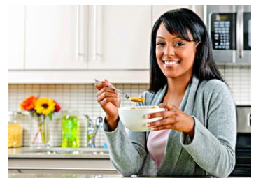
Un régime sain adapté à la perte de poids