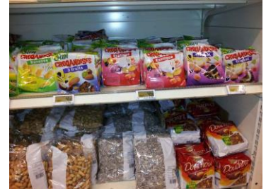
Mangues en mélange avec d'autres fruits

Selon Euromonitor, le volume des ventes de la distribution dans l'UE en céréales pour petits-déjeuners est estimé à 1,3 million de tonnes, soit 4 985 millions d'euros en 2013. Le volume des ventes est stable depuis 2005 dans les cinq principaux pays de l'UE (Royaume Uni, Allemagne, France, Espagne et Italie), soit 72 % du marché des céréales pour petits-déjeuners dans l'UE. Consommer