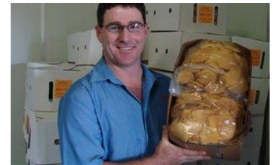
Un importateur vérifie la qualité

L'importateur vérifie la qualité à l'arrivée des mangues séchées. Il est établi par son propre inspecteur qualité, ou par un spécialiste engagé (par ex. un courtier, un agent ou un consultant) qui émet un rapport de qualité qui sert de base pour le règlement final à l'exportateur. Ensuite, l'importateur organise le transport en camion jusqu'à son propre centre de distribution, ou jusqu'au centre de conditionnement avec lequel il collabore.