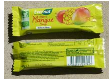
Barre à base de fruits et de mangue biologique (Evernat)