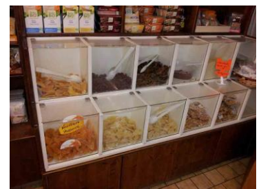
Mangues séchées en vrac chez primeur