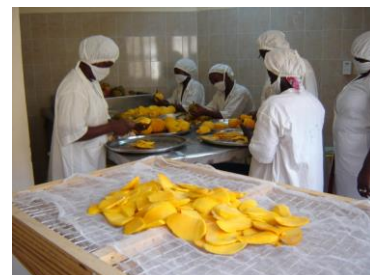
Découpe de mangues en tranche

Depuis le petit exploitant jusqu'au transformateur. Comme nous le montre la figure 1, les mangues destinées à être séchées sont fournies par les petits exploitants. Ceci inclut souvent des mangues qui ne sont pas retenues pour l'export. Elles sont ensuite transportées chez le transformateur, où elles sont coupées en tranches et séchées dans des fours.