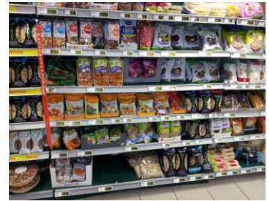
Rayon des fruits séchés et noix (Carrefour)

Les mangues séchées biologiques provenant du Burkina Faso sont principalement vendues dans des magasins ou petits supermarchés bio, par ex. Biocoop , Artisans du Monde . On peut également les trouver aux rayons alimentaires de chaînes de bien-être et nature, comme par ex. Nature ou des jardinerie.