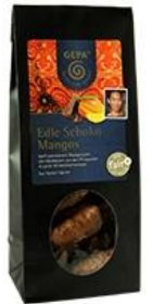
Mangues enrobées au chocolat (GEPA)

Par ailleurs, les principaux producteurs poursuivront leurs investissements dans des programmes concernant la durabilité, incluant le chocolat éthique et biologique, combiné ou non à des fruits tropicaux séchés comme la mangue. Étant donné le succès remporté par le chocolat issu du commerce équitable, la durabilité et la traçabilité dans la chaîne de valeurs du chocolat devraient devenir des critères d'achat majeurs pour les consommateurs. Les mangues séchées peuvent être enrobées de chocolat et vendues tout au long de l'année dans des emballages luxueux ( voir ici ) ou conditionnées spécialement pour Noël ou la Saint Valentin.