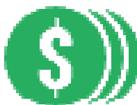
Position du Maroc par rapport aux exportations du Sénégal